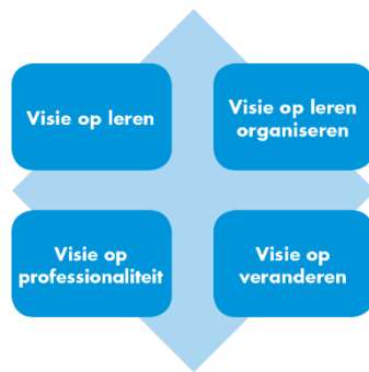
Figuur 1 – Het visiekloverblad

Wij kijken als team vanuit het onderstaande kwadrant naar de visie van ons onderwijs.