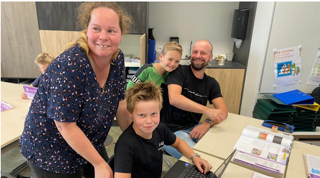
Er werd uitgelegd, gevraagd, geoefend en gelachen. Kortom: een perfecte schooldag!