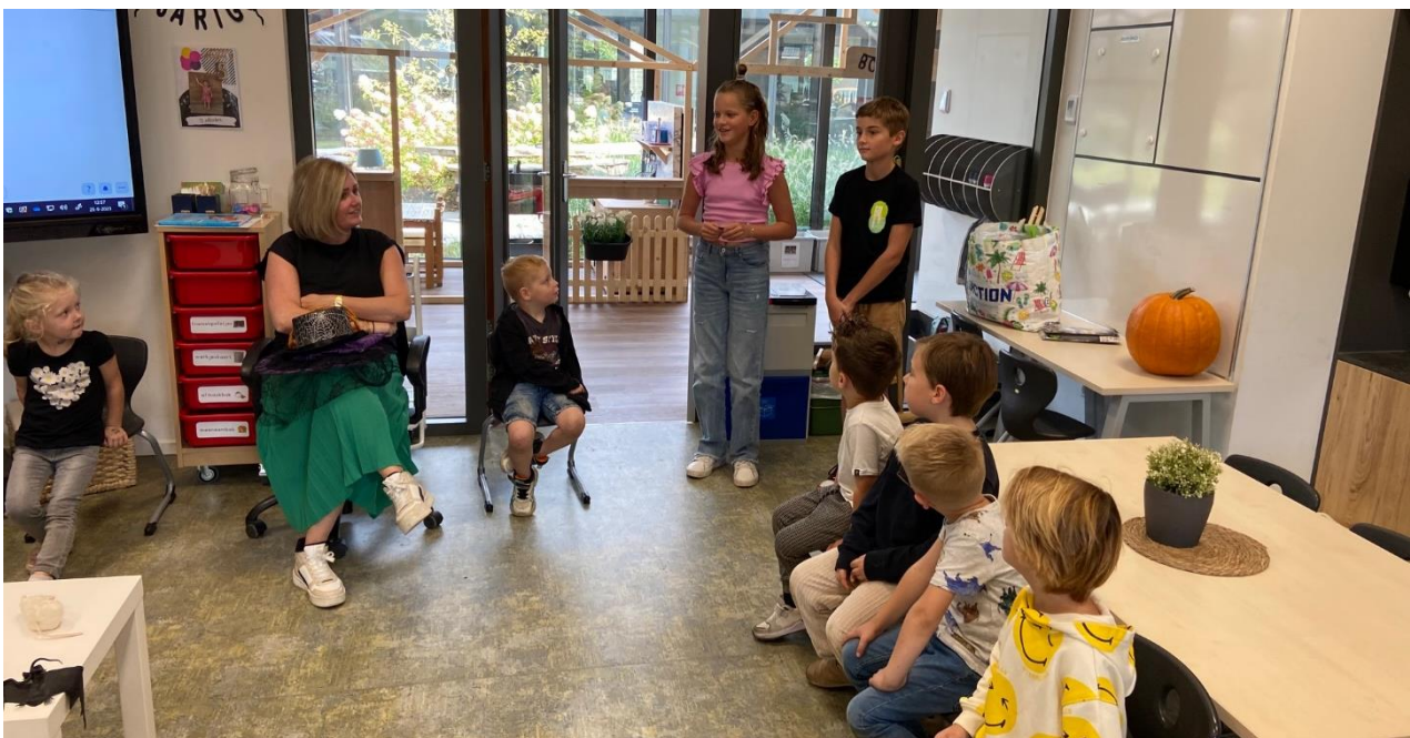
Leerlingen van groep 8 hebben de kleuters een compliment en een gouden muntje gegeven voor het fijne werken op de gang. Vol trots namen de kleuters het compliment en het muntje in ontvangst.