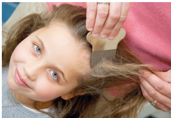
De uitkambehandeling is het meest natuurlijke middel tegen hooftluis

Als de uitkambehandeling niet heeft gewerkt dan kunt u dit herhalen in combinatie met een antihooftluismiddel.