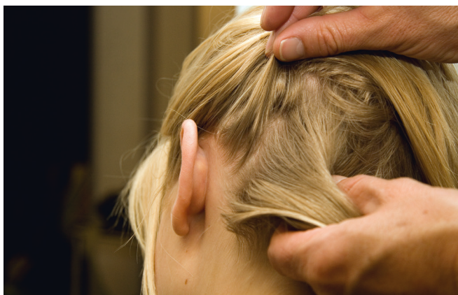
Als u op hoofdluis controleert, kijk dan goed tussen de haren.