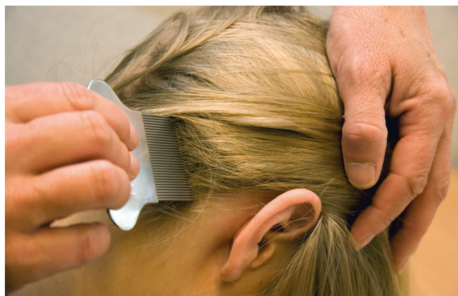
Kam het haar met een fijntandige kam boven een wit papier of de wasbak.