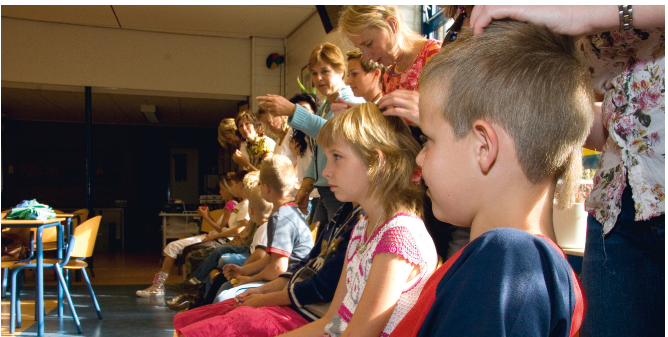
Een ouderwerkgroep kan op school de kinderen regelmatig controleren.

De GGD adviseert en coördineert bij de bestrijding van hoofdluis. Bijvoorbeeld door voorlichting te geven aan scholen, leerkrachten en ouders. Bij de GGD werken verpleegkundigen en doktersassistenten die u kunnen helpen en adviseren als het niet lukt een hoofdluisprobleem op te lossen. De GGD volgt daarbij de richtlijn Hoofdluis van het Rijksinstituut voor Volksgezondheid en Milieu. Ook kan de GGD helpen bij het opstellen van informatiebrieven.