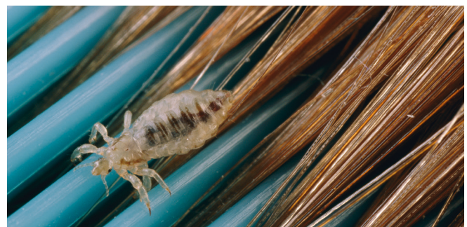
Een hoofdluis op een kam.

Hoofdluis is beslist geen drama en u hoeft uzelf niets te verwijten als uw kind hoofdluis heeft. Het is onschadelijk, maar het kan veel jeuk geven. En door krabben kunnen er infecties ontstaan. Het krijgen van hoofdluis heeft niets te maken met lichamelijke hygiëne.